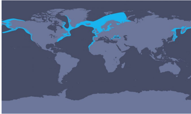
Map dosbarthiad (Cadwraeth Morfilod a Dolffiniaid)

Prin iawn y bydd llamhidydd yr harbwr yn ymddwyn mewn ffordd chwareus, sy'n dal sylw, ac nid yw'n neidio'n acrobatig, yn llamu ac yn slapio'r cynffon fel y dolffin trwynbwl. Mae'n nofio'n araf fel arfer ac i'w weld yn unigol neu mewn grwpiau bwydo bach yn aml. Y grŵp cymdeithasol mwyaf cyffredin yw'r fam a'r llo. Fel arfer bydd yr anifeiliaid swil yma yn osgoi cychod ac unrhyw beth arall ar y dŵr. Gan eu bod yn fach mae'n rhaid iddynt fwydo'n gyson i gynnal tymheredd eu corff yn ein moroedd oer, ac mae hyn yn golygu bod gor-bysgota yn gallu arwain at ddirywiad yn eu hadnoddau bwyd. Maent yn bwydo'n bennaf ar rywogaethau o bysgod sy'n byw ar waelod y môr, fel llymriod, sy'n golygu eu bod mewn perygl o gael eu dal fel 'sgil-ddalfa' - trwy fynd ynghlwm yn ddamweiniol mewn rhwydi pysgota. Mae llamhidydd yr harbwr hefyd yn bwydo ar bysgod heigiog fel y pennog a'r gwyniad. Fel arfer byddant yn dilyn symudiadau ysglyfaethu tymhorol, gan symud i'r lan yn yr haf ac allan i'r môr yn y gaeaf.